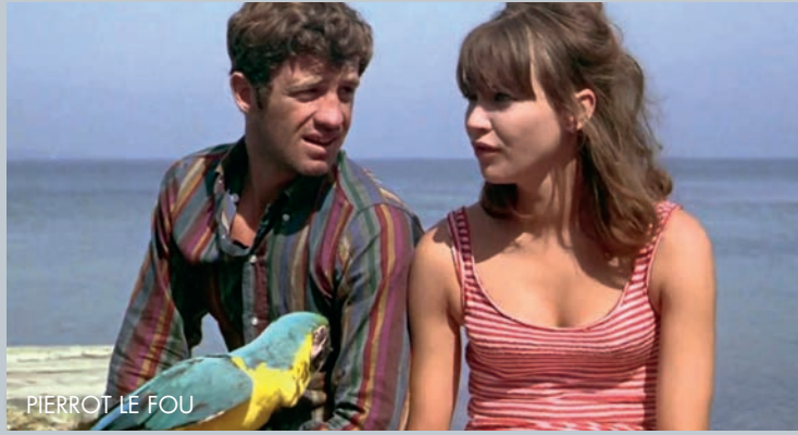
PIERROT LE FOU