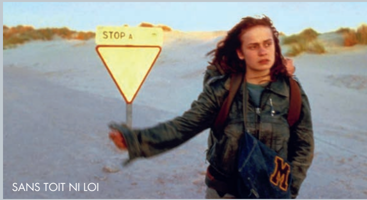
SANS TOIT NI LOI